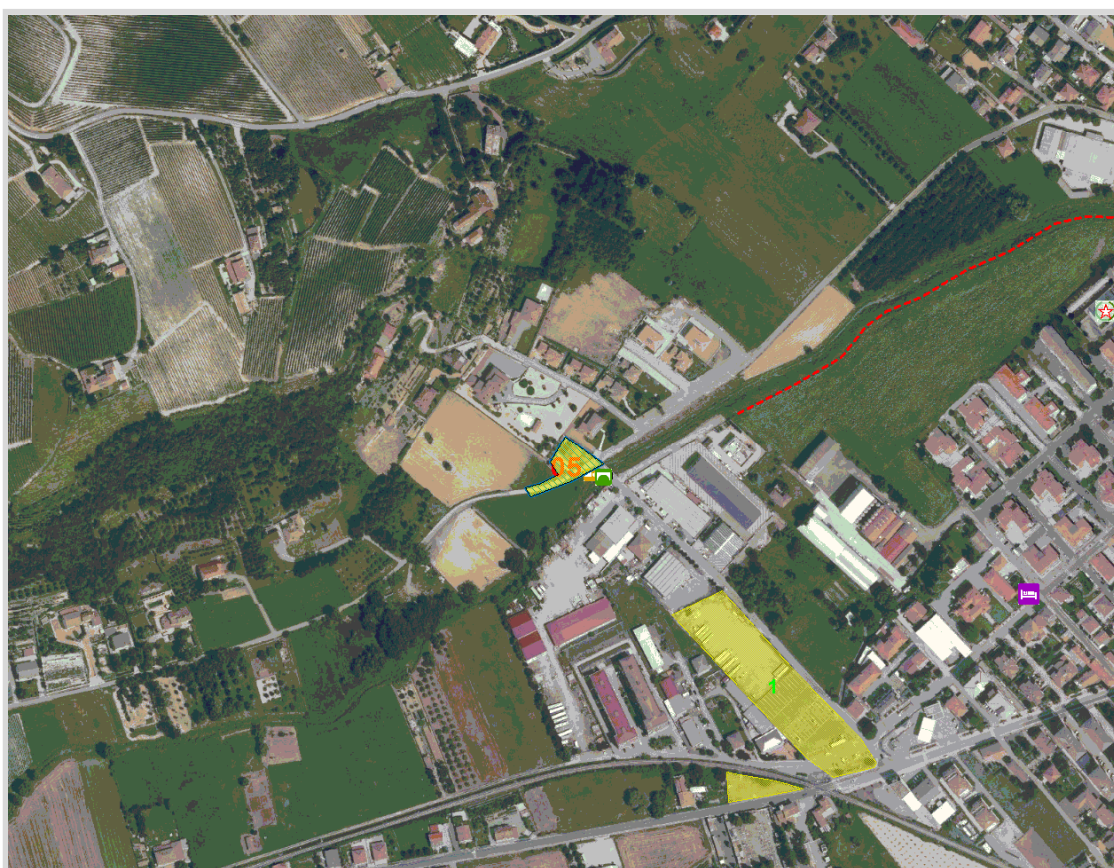
GisMaster-ProtezioneCivile - Estratto della cartografia