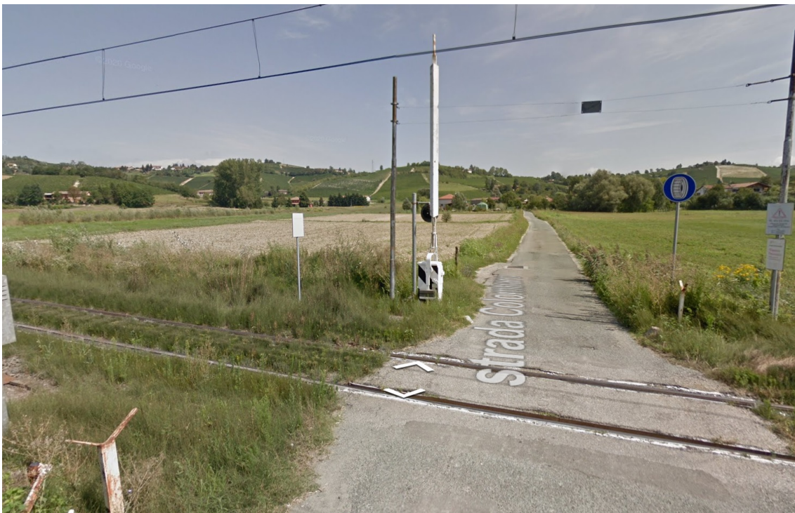
Immagine Google - Street View