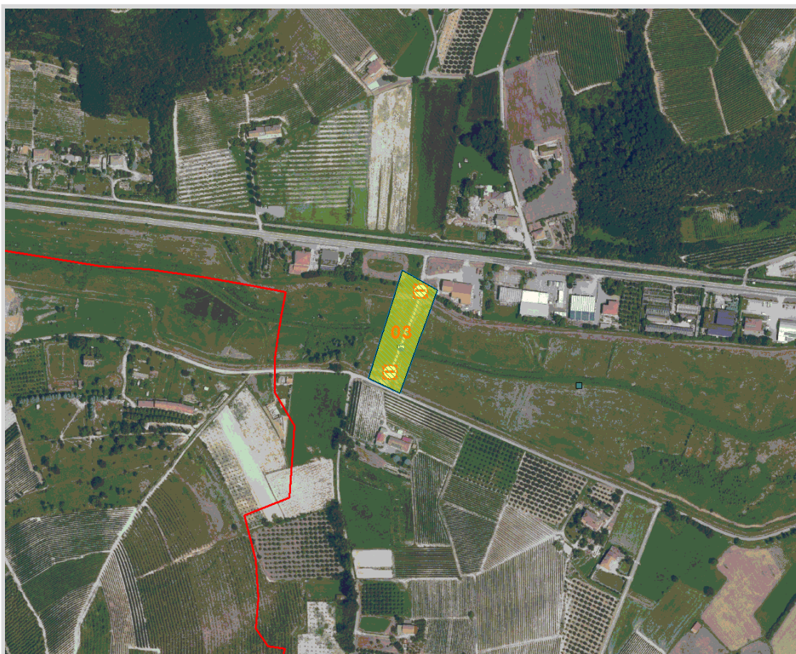
GisMaster-ProtezioneCivile - Estratto della cartografia