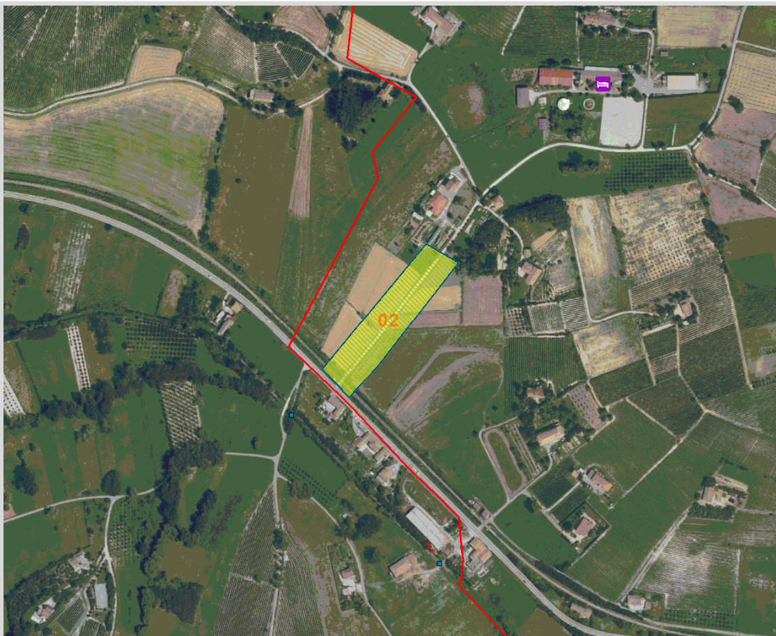
GisMaster-ProtezioneCivile - Estratto della cartografia