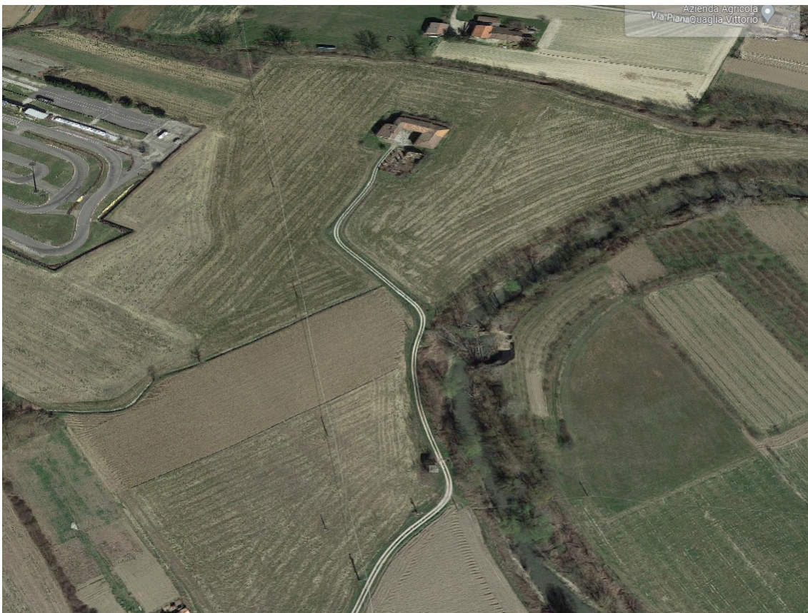
Immagine Google Maps - 3D