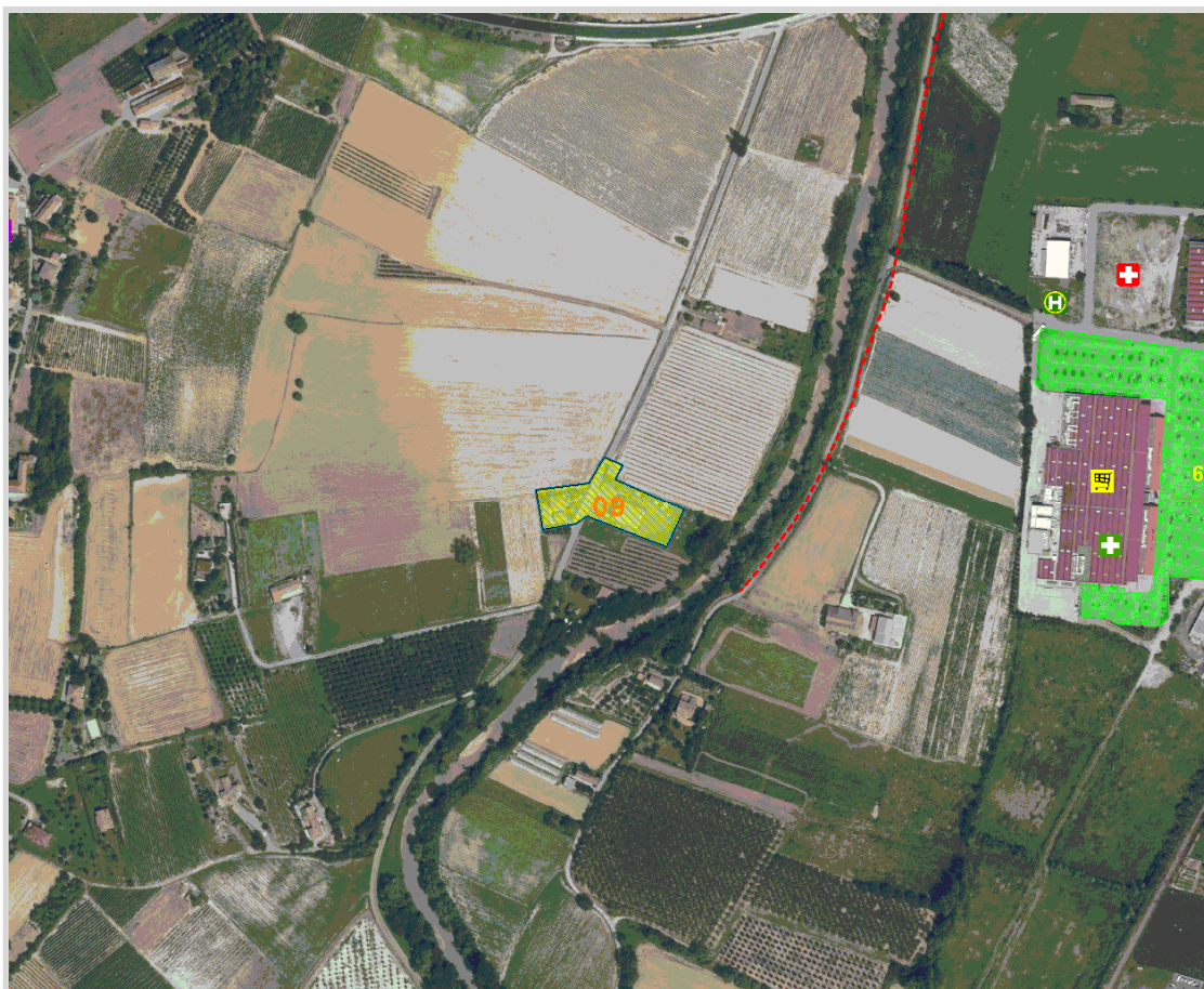
GisMaster-ProtezioneCivile - Estratto della cartografia