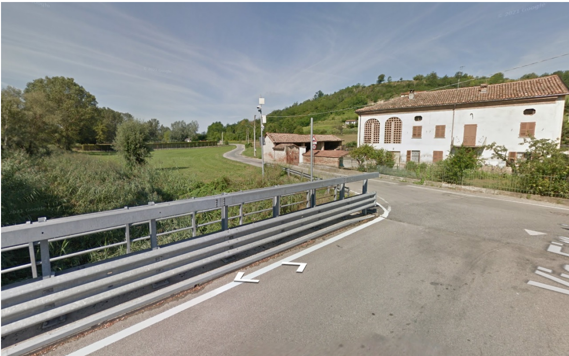
Immagine Google - Street View