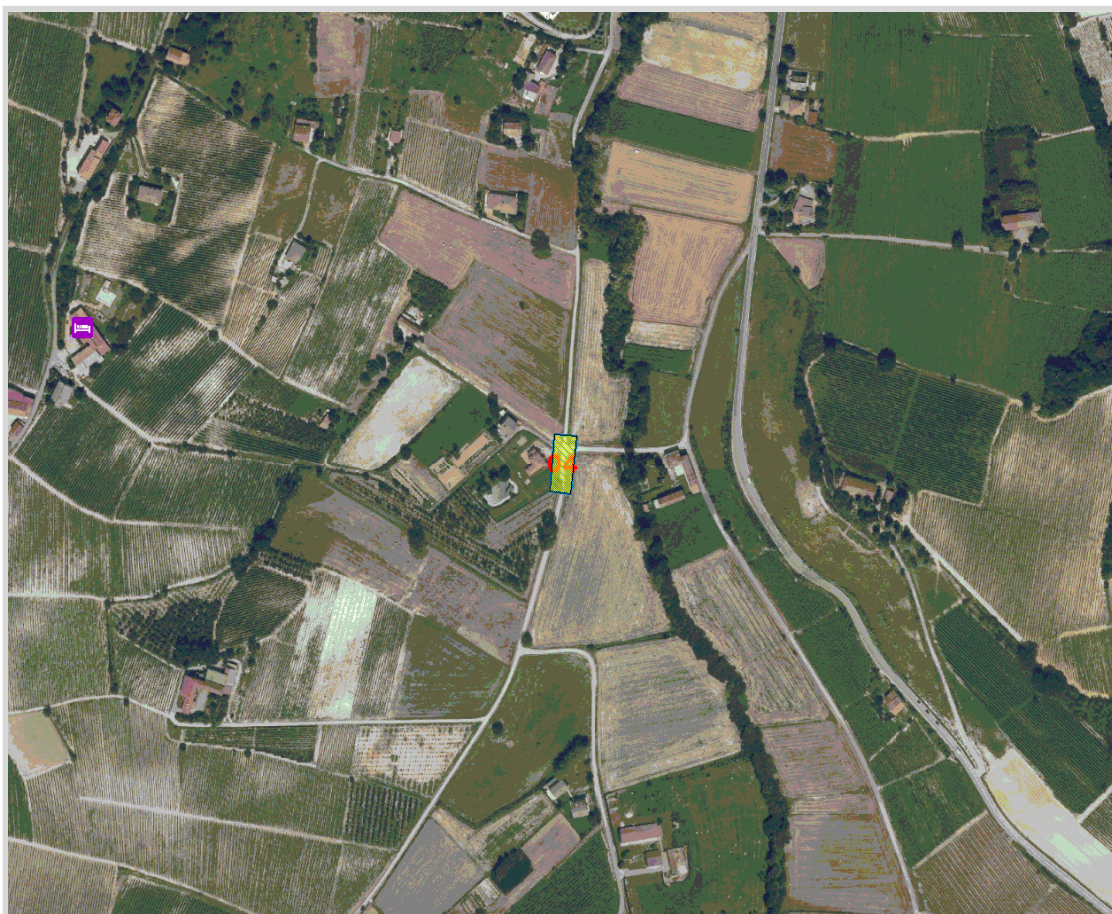
GisMaster-ProtezioneCivile - Estratto della cartografia