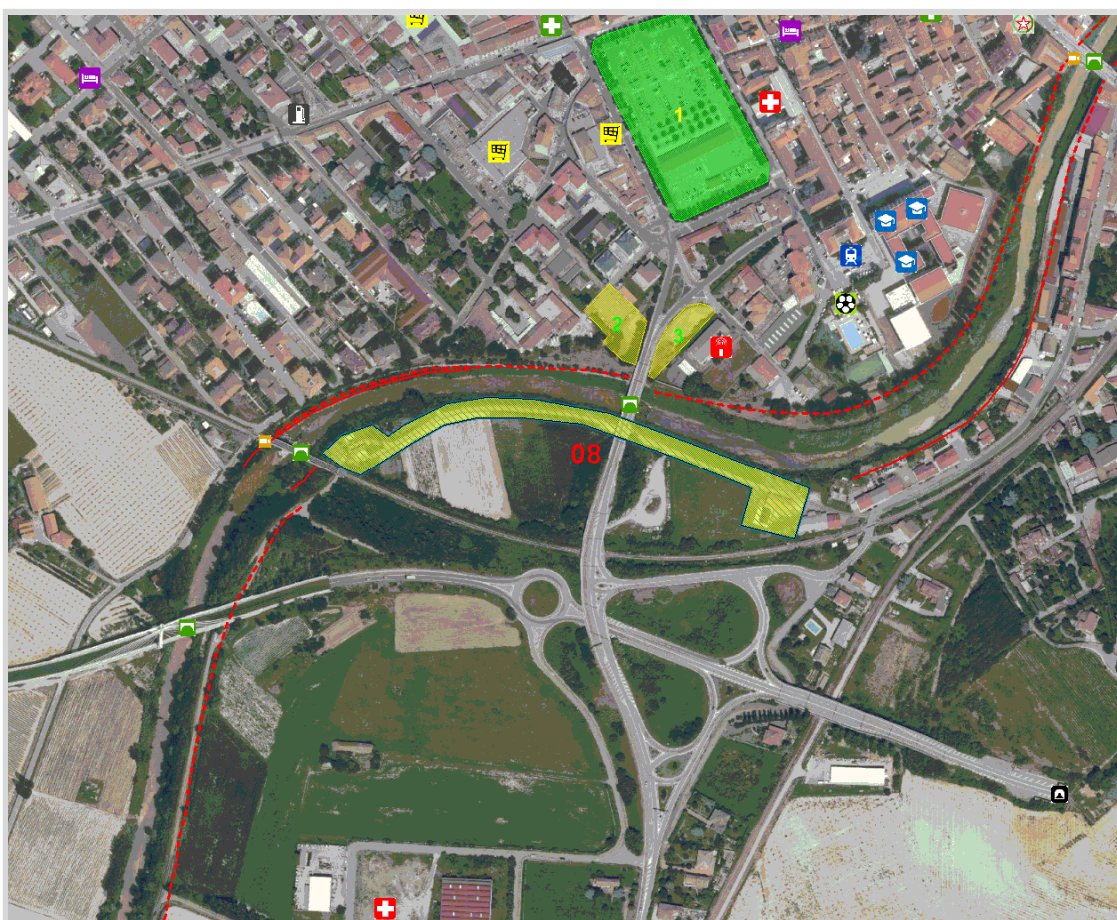
GisMaster-ProtezioneCivile - Estratto della cartografia