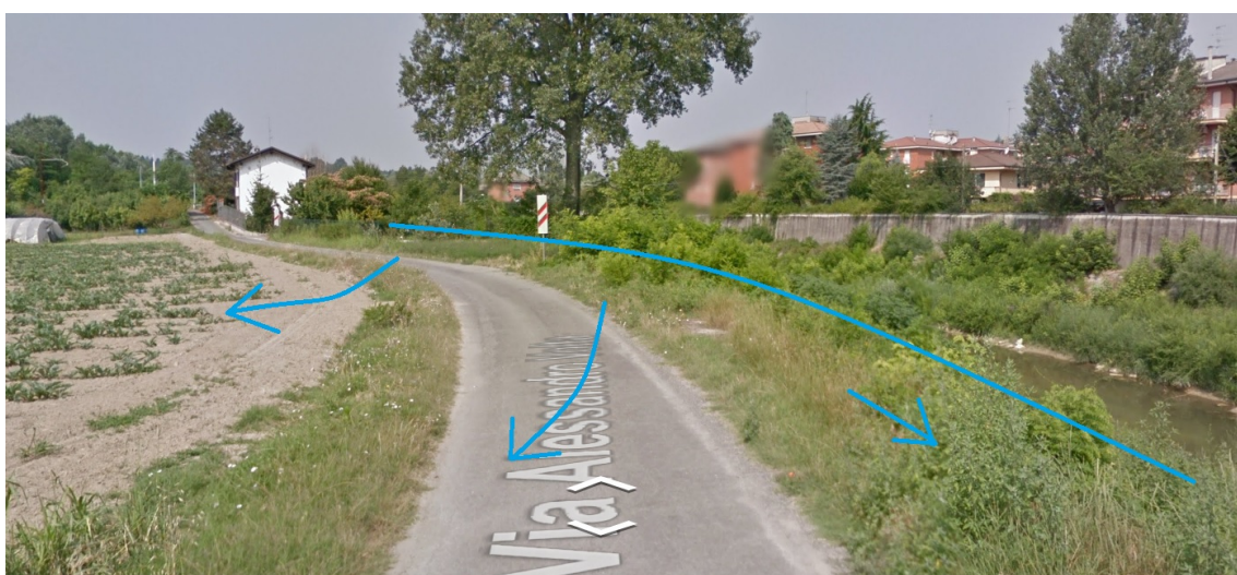
Immagine Google - Street View