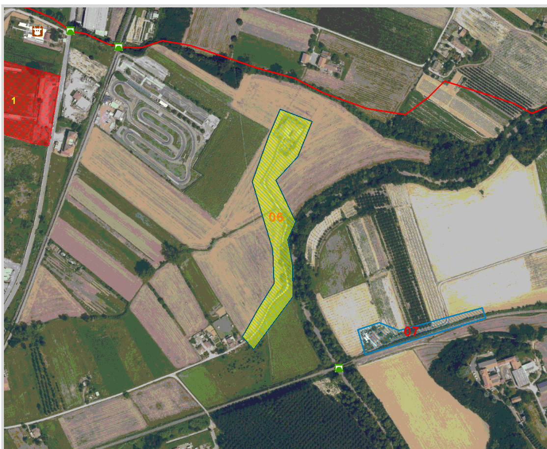
GisMaster-ProtezioneCivile - Estratto della cartografia