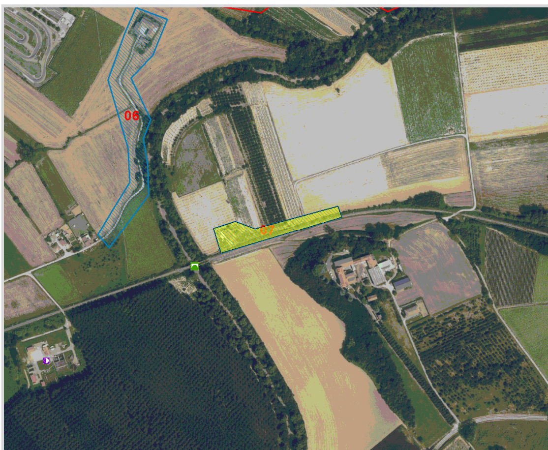
GisMaster-ProtezioneCivile - Estratto della cartografia